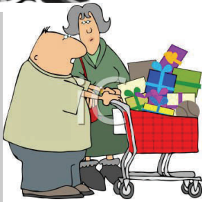
4. Los abuelos

Parte II (continued). Please write a description of the pictures given. Be sure to write quality sentences. Use your vocab sheets! 7-8 words!